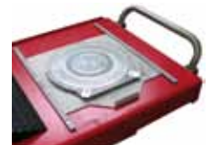
AT / ATLT